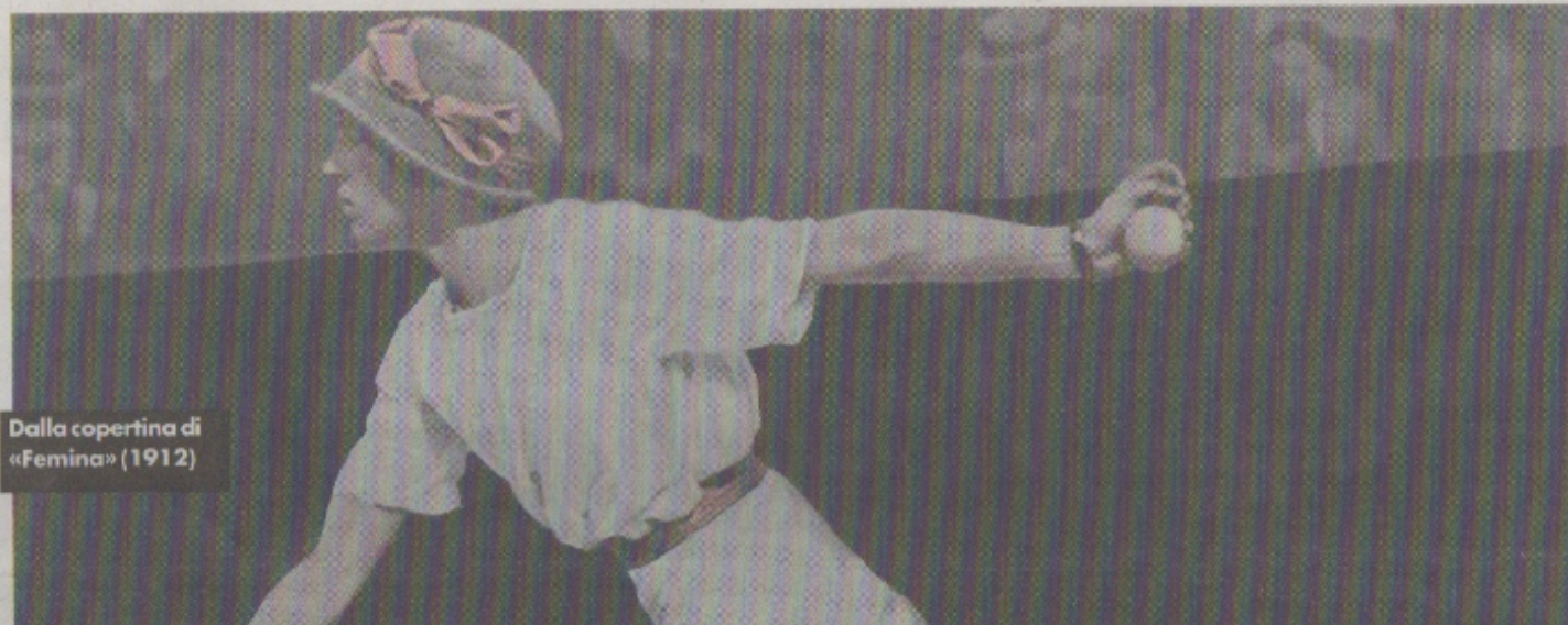
Dalla copertina di «Femina» (1912)